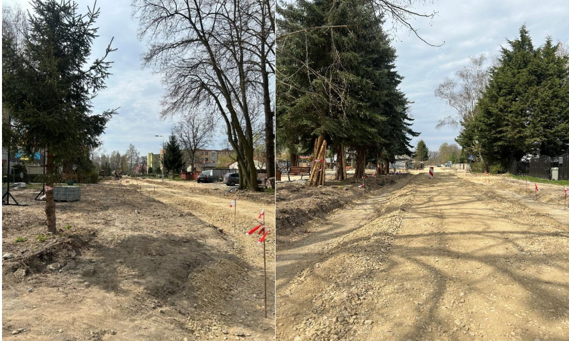
Zdjęcie 4 Przebudowa infrastruktury drogowej w Wiechlicach ul. Lipowa

Wartość dofinansowania: 2 000 000,00 zł.