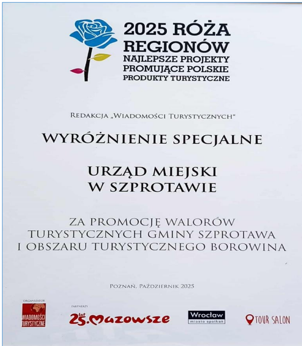
Zdjęcie 25 Wyróżnienie Specjalne Róża Regionów