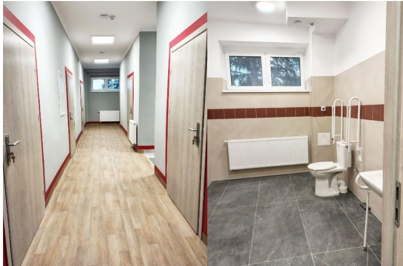
Zdjęcie 16 Wnętrze Centrum Usług Wspólnych w Szprotawie

Wartość kontraktu: 1 433 743,35 zł brutto