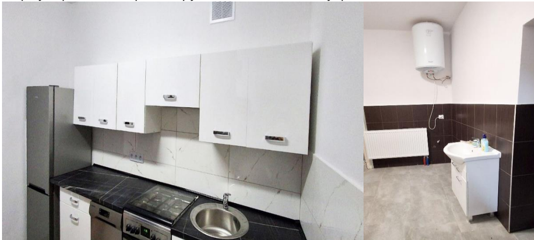
Zdjęcie 19 Modernizacja zaplecza sanitarnego w OSP w Długiem

Dzięki tej inwestycji remiza stała się miejscem bardziej przyjaznym, estetycznym i funkcjonalnym, które lepiej odpowiada na potrzeby jednostki OSP i lokalnej społeczności.