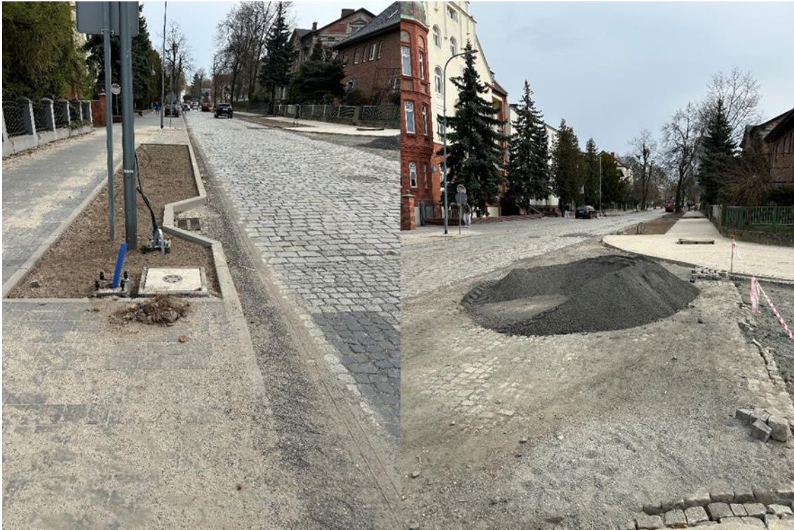
Zdjęcie 2 Modernizacja ul Niepodległości - Etap IV

sygnalizacji świetlnej na przejściach dla pieszych, kanalizacji deszczowej, oznakowania aktywnego lub sygnalizacji ostrzegawczej na przejściach dla pieszych. Ponadto przebudowa części jezdni, rozbiórka części istniejącej jezdni i budowa nowej jezdni po trasie istniejącej drogi, przebudowa i odbudowa pozostałych elementów dróg, ulic, tj. poboczy, przepustów i rowów drogowych, istniejącej infrastruktury technicznej kolidującej z przebudowaną drogą, w tym sieci i przyłączy elektroenergetycznych, wodociągowych, teletechnicznych i gazowych.