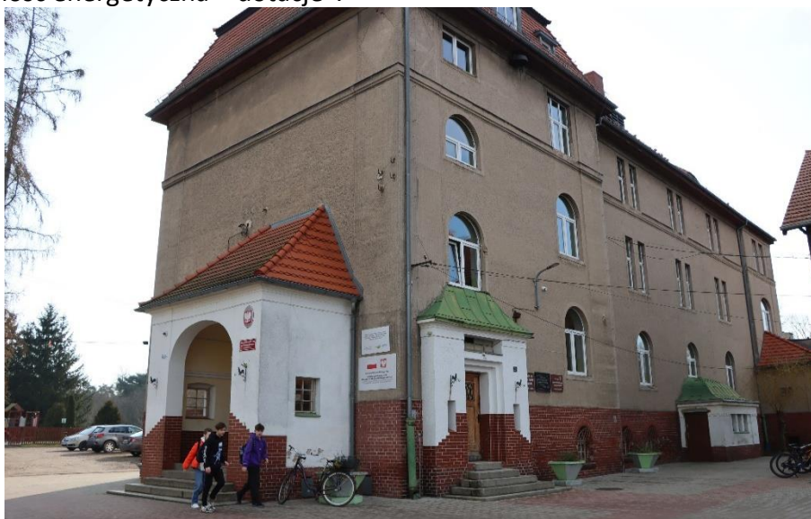
Zdjęcie 15 Budynek Szkoły Podstawowej nr 2 w Szprotawie

Projekt jest współfinansowany przez Unię Europejską ze środków Europejskiego Funduszu Rozwoju Regionalnego w ramach Programu Fundusze Europejskie dla Lubuskiego 2021-2027, Priorytetu 2 „Fundusze Europejskie na zielony rozwój Lubuskiego”, Działanie 2.1 „Efektywność energetyczna – dotacje”.