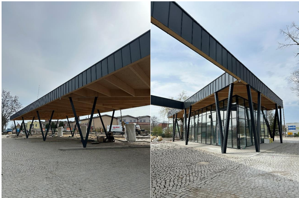
Zdjęcie 20 Centrum przesiadkowe Via Szprotavia w Szprotawie

W budynku znajdować się będzie poczekalnia dla podróżnych, toalety, w tym dla osób z niepełnosprawnościami, pomieszczenie socjalne dla kierowców oraz pomieszczenie gospodarcze. Wiata ma pomieścić cztery dwustanowiskowe ładowarki elektryczne oraz magazyn energii. Jej zadaniem ma posłużyć do montażu instalacji fotowoltaicznej.