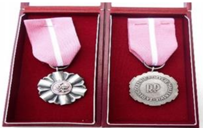
Zdjęcie 1 Medal za długoletnie pożycie małżeńskie

Od 2015 roku wnioski o wydanie odpisu aktu stanu cywilnego można złożyć do wybranego Urzędu Stanu Cywilnego. Wnioski o wydanie odpisów można składać osobiście, listownie lub przez Internet. Można również wybrać w jakiej postaci otrzymać odpis – elektronicznej czy papierowej.