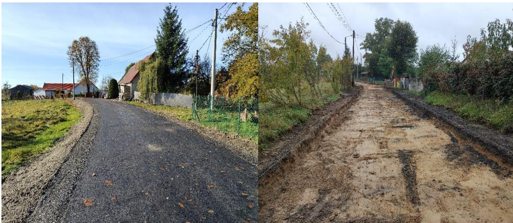
Zdjęcie 11 Modernizacja dróg dojazdowych do gruntów rolnych w miejscowości Dziećmiarowice