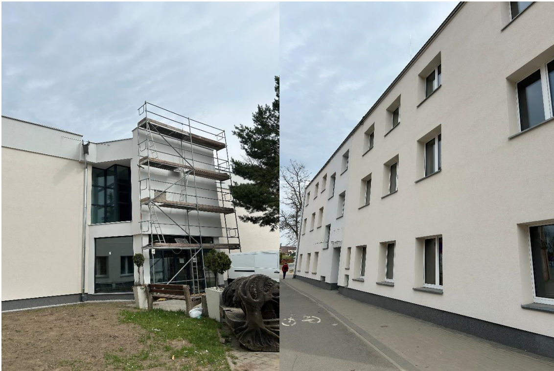
Zdjęcie 17 Termomodernizacja Domu Kultury w Szprotawie