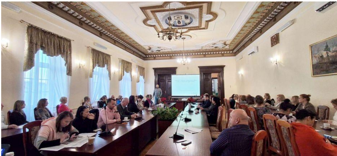
Zdjęcie 26 11–12 grudnia 2025 r. szkolenie z zakresu ochrony ludności i obrony cywilnej

W ramach realizacji programu przeprowadzono również szkolenia z zakresu ochrony ludności i obrony cywilnej dla pracowników Urzędu Miejskiego w Szprotawie oraz kierowników jednostek podległych.