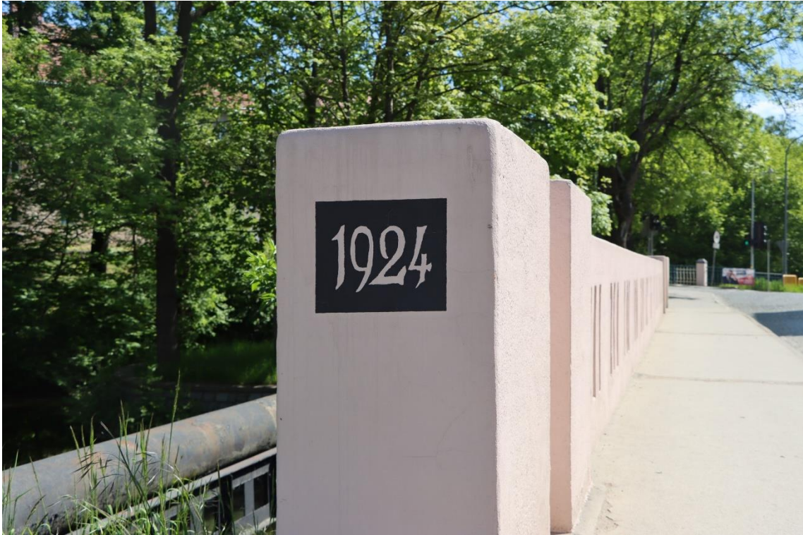
Zdjęcie 8 Most w ciągu ul. Krasieńskiego w Szprotawie

autorskiego nad wykonywanymi robotami budowlanymi oraz zapewnienie nadzoru archeologicznego i saperskiego zgodnie z postanowieniami Umowy Wykonana została dokumentacja projektowa na podstawie Programu Funkcjonalno-Użytkowego. W miesiącu kwietniu 2026 planowane jest rozpoczęcie robót remontowych.