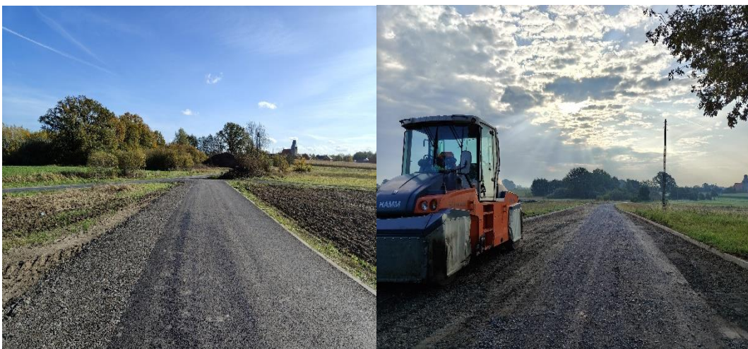
Zdjęcie 12 Modernizacja dróg dojazdowych do gruntów rolnych w miejscowości Siecieborzyce