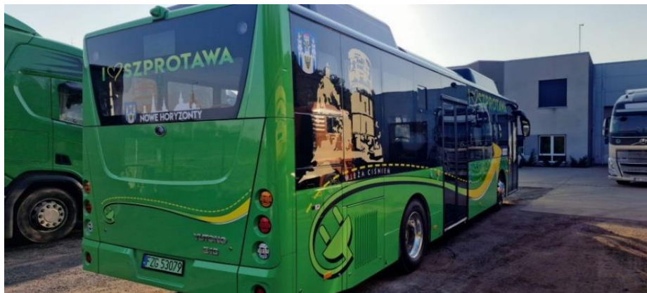
Zdjęcie 22 Nowoczesne autobusy elektryczne marki YUTONG

Zadanie obejmuje dostawę 8 szt. autobusów elektrycznych wraz z udzieleniem instruktarzu min. 12 kierowcom. Termin wykonania: luty 2026 r.