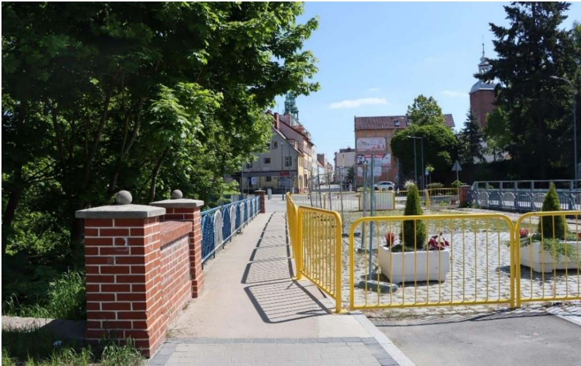
Zdjęcie 9 Zabytkowy most w ciągu ul. Mickiewicza w Szprotawie