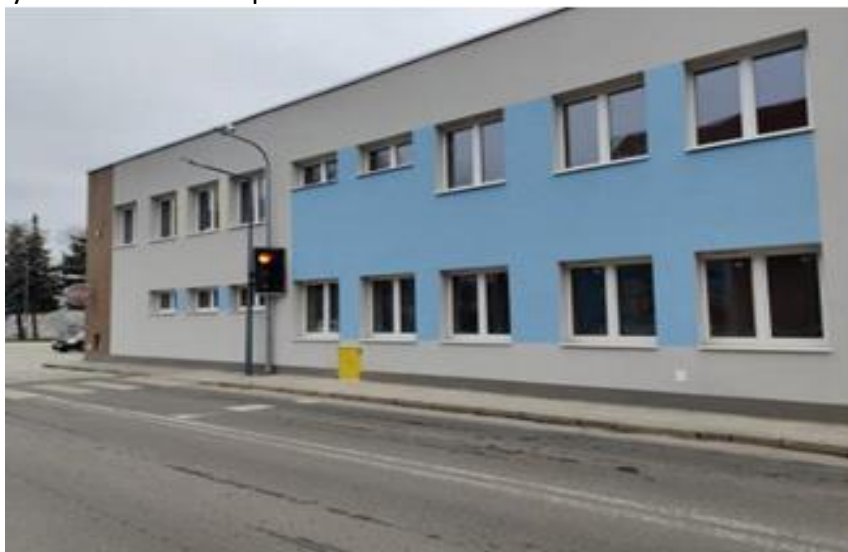
Zdjęcie 14 Budynek żłobka „Chatka Dinusia” w Szprotawie

W ramach realizacji przedsięwzięcia zaplanowano utworzenie 44 miejsc opieki nad dziećmi w wieku do lat 3 na terenie Gminy Szprotawa, w formie żłobka. Placówka mieści się w odremontowanym budynku przy ul. Krasińskiego 7 w Szprotawie, w którym dawniej mieściła się szkoła. Łączna powierzchnia użytkowa budynku wynosi około 700m 2 , w ramach, których utworzenie zostały trzy sale na pobyt zbiorowy dzieci o powierzchni łącznej około 210 m 2 oraz pomieszczenia gospodarcze i administracyjne. Dodatkowo, przy obiekcie został utworzony nowy plac zabaw, przeznaczony wyłącznie dla dzieci uczęszczających do żłobka w Szprotawie.