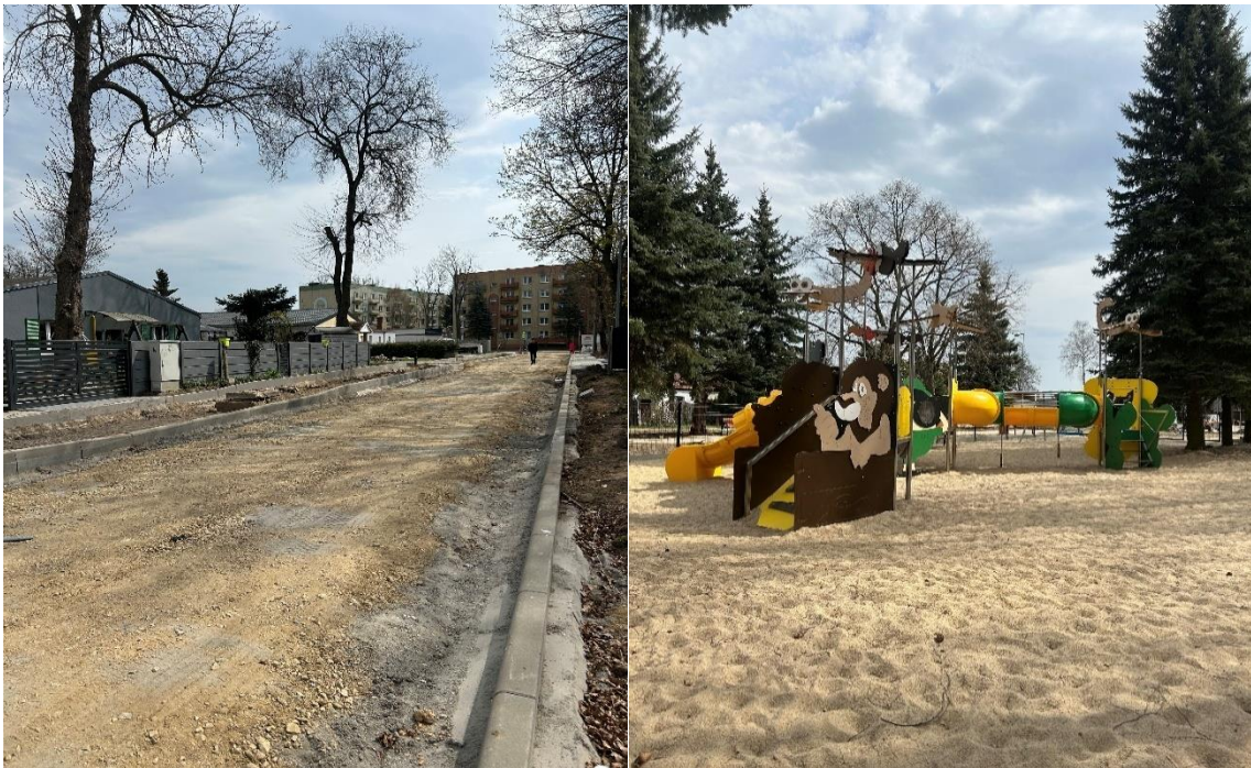
Zdjęcie 5 Przebudowa infrastruktury drogowej w Wiechlicach ul. Lipowa