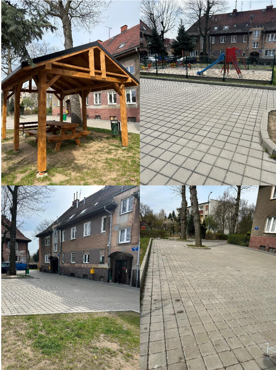
Zdjęcie 13 Zagospodarowanie podwórka przy ul. Lotników w Szprotawie

Wykonano nawierzchnię drogi i parkingu z kostki brukowej wokół placu zabaw, Wybudowano wiatę drewnianą z ławostółem oraz nowy plac zabaw