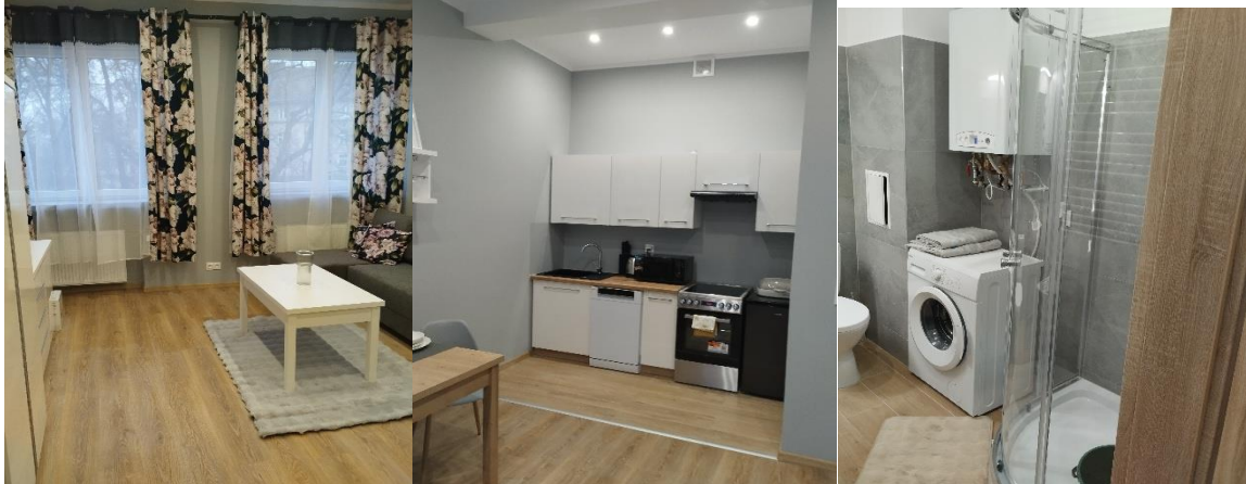
Zdjęcie 23 Wyremontowany lokal 1 w Szprotawie przy ul. Krasińskiego 23

W ramach realizacji zadania przeprowadzono remont oraz wyposażenie mieszkań, dostosowując lokale do potrzeb rodzin repatriantów i zapewniając warunki umożliwiające ich osiedlenie oraz rozpoczęcie funkcjonowania na terenie gminy.