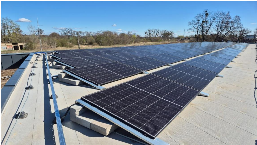
Zdjęcie 21 Instalacja fotowoltaiczna wraz z magazynem energii

Projekt jest współfinansowany przez Unię Europejską ze środków Europejskiego Funduszu Rozwoju Regionalnego w ramach Programu Fundusze Europejskie dla Lubuskiego 2021-2027, Priorytet 2 „Fundusze Europejskie na zielony rozwój Lubuskiego”, Działanie 02.12 Odnawialne źródła energii – IIT.