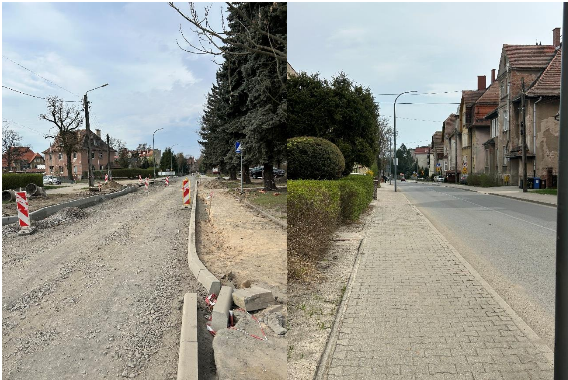
Zdjęcie 7 Remont ul. Kolejowej i ul. Kopernika w Szprotawie