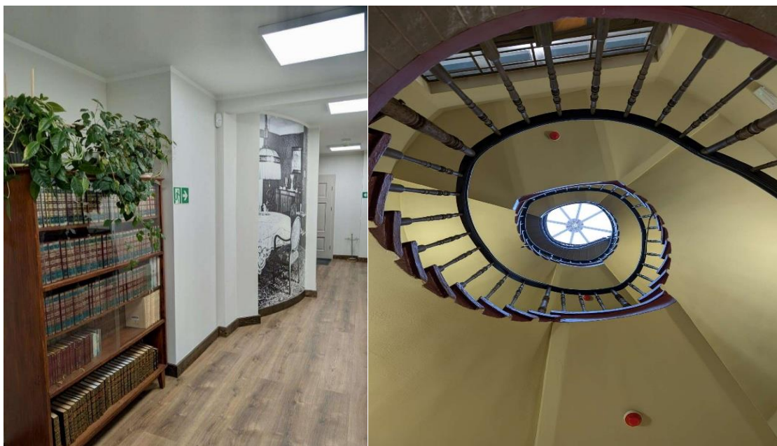
Zdjęcie 18 Wnętrze Miejskiej Biblioteki Publicznej w Szprotawie