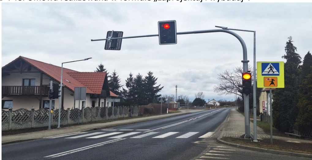
Zdjęcie 6 Sygnalizacja świetlna w miejscowości Borowina

Projekt zakładał montaż sygnalizacji świetlnej pracującej w trybie ALL RED z detekcją ruchu pojazdów wyposażoną w radarowe czujniki prędkości w ciągu drogi wojewódzkiej nr 297, w obrębie istniejącego przejścia dla pieszych w miejscowości Borowina zlokalizowanego w km 21+748. Umowa realizowana w formule „zaprojektuj i wybuduj”.