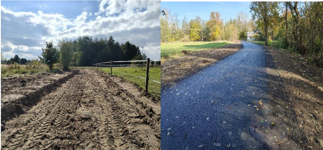
Zdjęcie 10 Modernizacja dróg dojazdowych do gruntów rolnych w miejscowości Długie