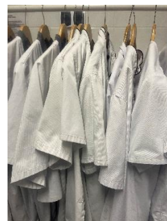
Przygotowane pranie do odbioru

ZAZ prowadzi jeszcze jeden dział, tj. dział drobnych prac zleconych. Tu wykonujemy dla naszych kontrahentów drobne prace na zlecenie, które są tylko małym elementem w ich znacznie bardziej skomplikowanym procesie produkcyjnym. Te proste prace są dla naszych zleceniodawców często bardzo czasochłonne, ale możliwość wykonywania ich po za siedzibą kontrahenta stwarza nowe możliwości dla naszych pracowników z niepełnosprawnościami. Korzyści takiej współpracy są po obu stronach, z jednej strony nasi pracownicy dostają jedną z najcenniejszych wartości dla człowieka jaką jest możliwość pracy, a z drugiej zleceniodawca może powierzyć swoim pracownikom bardziej skomplikowane i odpowiedzialne zadania. W dziale tym nasi pracownicy, w zależności od potrzeb kontrahentów, składają narożniki lub zawieszki. W tej dziedzinie chętnie nawiążemy współpracę z nowymi kontrahentami tak aby zróżnicować wykonywane prace.