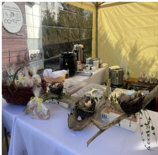
Jarmark Wielkanocny 2025

Nasze miejskie jarmarki też są wydarzeniami gdzie Państwo mogą nas spotkać ponieważ zawsze chętnie w nich uczestniczymy. W roku 2025 braliśmy udział w Jarmarku Wielkanocnym oraz Jarmarku Bożonarodzeniowym gdzie, jak zawsze, zaprezentowaliśmy swoje własne wyroby. Zawsze dokładamy wszelkich starań aby nasze stoiska przyciągały klientów nie tylko naszymi produktami ale również samym wyglądem.