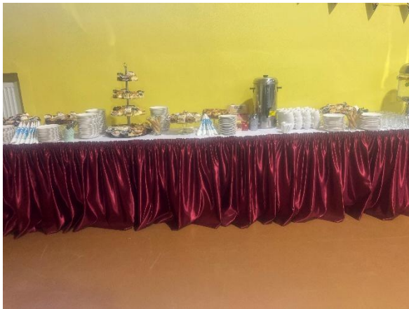
80-lecie SP nr!