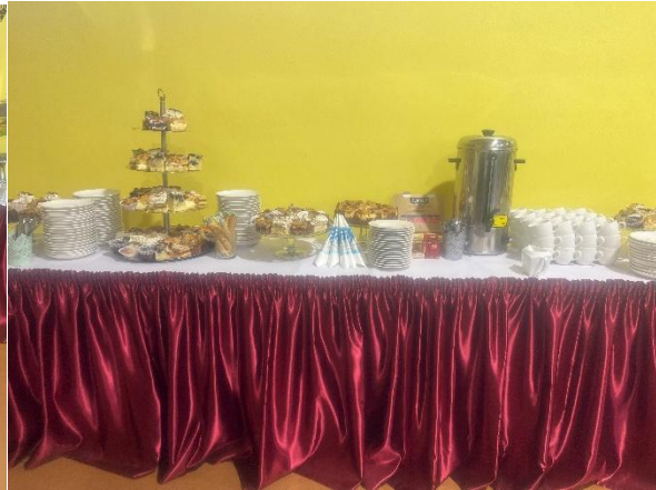
80-lecie SP nr 1

Nasze miejskie jarmarki też są wydarzeniami gdzie Państwo mogą nas spotkać ponieważ zawsze chętnie w nich uczestniczymy. W roku 2025 braliśmy udział w Jarmarku Wielkanocnym oraz Jarmarku Bożonarodzeniowym gdzie, jak zawsze, zaprezentowaliśmy swoje własne wyroby. Zawsze dokładamy wszelkich starań aby nasze stoiska przyciągały klientów nie tylko naszymi produktami ale również samym wyglądem.