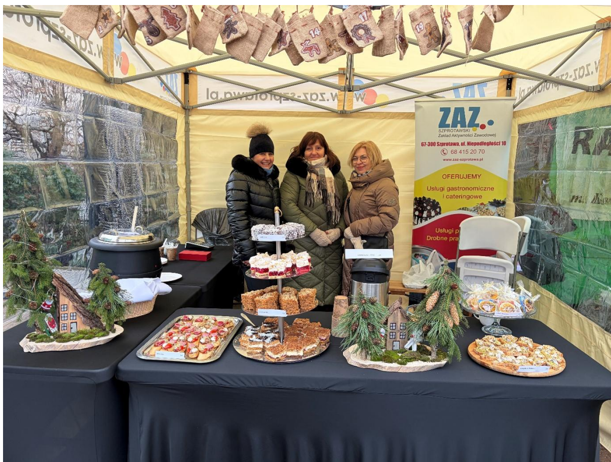
Jarmark Bożonarodzeniowy 2025

Kolejną pracownią, którą prowadzi zakład jest pralnia wodna. To właśnie tu są świadczone usługi prania i maglowania. Nasza pralnia jest działem, który nie stanowił w swoich założeniach miejsca generującego większe dochody dla ZAZ, ale od samego początku stanowi bardzo ważną alternatywę podjęcia zatrudnienia dla ograniczonych możliwości osób z niepełnosprawnościami. Czas pokazał, że prowadzenie pralni jest coraz większym atutem naszego zakładu. Świadczymy tu usługi dla klientów indywidualnych oraz kontrahentów prowadzących działalność gospodarczą (najczęściej w branży gastronomicznej i hotelarskiej). Rok 2025 potwierdził, że wykonane wcześniej w tym dziale inwestycje były trafione i potrzebne. Podejmowane działania doprowadziły do konieczności podjęcia działań mających na względzie poprawę warunków pracy i bezpieczeństwa pracowników w pralni. W związku z tymi działaniami przeprowadzono remont i adaptację pomieszczeń przeznaczonych na pralnię oraz zakupiono nowy sprzęt pralniczy. Remont obejmował kompleksową modernizację pomieszczeń pralni. Dzięki znacznym środkom z zakładowego funduszu aktywności udało się w znacznym stopniu poprawić funkcjonalność i bezpieczeństwo w pralni. Dodatkowe środki