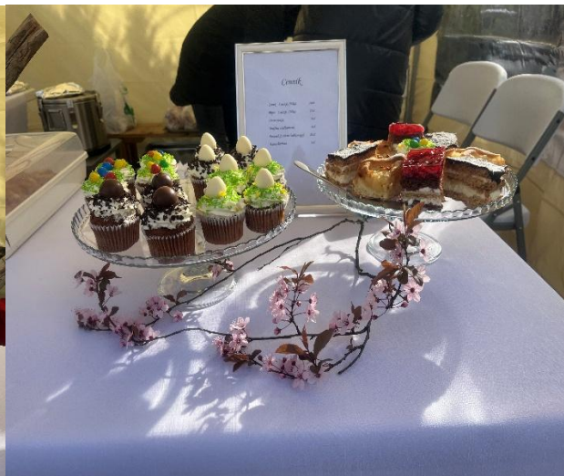
Jarmark Wielkanocny 2025