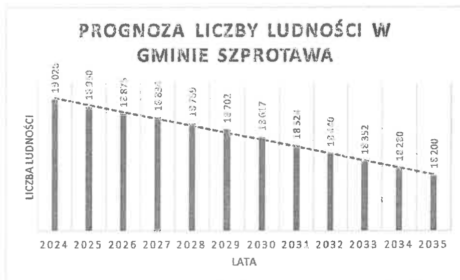
Wykres 3: Prognoza ludności (ogółem) w Gminie Szprotawa