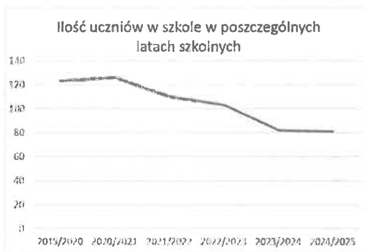
Wykres 1. Ilość uczniów w szkole w latach 2019-2024

Z przedstawionych powyżej danych wynika, że na przestrzeni ostatnich 6 lat szkolnych liczba uczniów znacząco się zmniejszyła, ponieważ aż o 42 uczniów, co stanowi połowę obecnej ilości wszystkich uczniów szkoły.