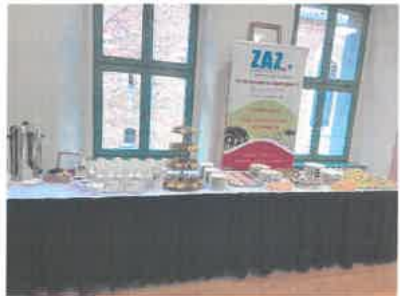
Catering w Magdalenkach przygotowany na zlecenie gminy – 2023r