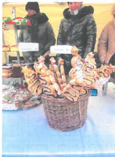
Jarmark Bożonarodzeniowy 2023r.

Kolejną pracownią, którą prowadzi zakład jest pralnia wodna. Tu właśnie są świadczone usługi prania i maglowania. Nasza pralnia jest działem, który nie stanowi, w założeniach zakładu, znacznego miejsca generującego dochody ZAZ, ale stanowi bardzo ważną alternatywę dla ograniczonych możliwości osób z niepełnosprawnościami. Prowadzona pralnia to pralnia wodna. Świadczymy tu usługi dla klientów indywidualnych oraz kontrahentów prowadzących działalność gospodarczą (najczęściej w branży gastronomicznej i hotelarskiej). W roku 2023 pralnia dzięki zakupionej pod koniec 2022 roku nowej pralnicy oraz suszarce zaczęła zwiększać swoje obroty. Jednak rozwinięcie parku maszynowego w pralni zmusiło nas do rozbudowy sieci elektrycznej w taki sposób aby nasze maszyny mogły wszystkie równocześnie pracować. W dziale tym wykonywane są proste prace, które pozwalają na to aby pracowały tu osoby z różnymi ograniczeniami oraz bez doświadczenia zawodowego.