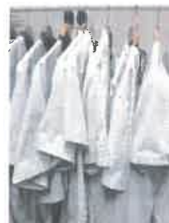
Przygotowane pranie do odbioru