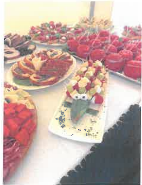
Catering dla firmy Minth - wrzesień 2023r.

Bierzemy udział w jarmarkach gminnych (Wielkanocnych oraz Bożonarodzeniowych) gdzie na swoich stoiskach prezentujemy swoje własne wyroby. W okresach przedświątecznych mamy specjalne cateringowe oferty dla naszych klientów.