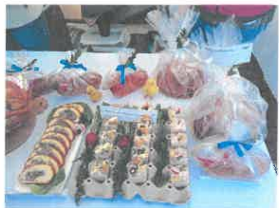
Jarmark Wielkanocny 2023r.